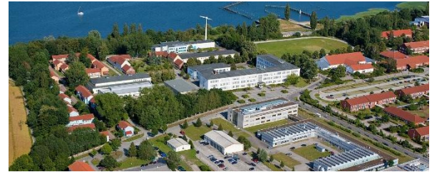
Veranstaltungsort: HOST – Hochschule Stralsund, Zur Schwedenschanze 15

Weitere Infos erhalten Sie mit der Einladung in den kommenden Wochen.